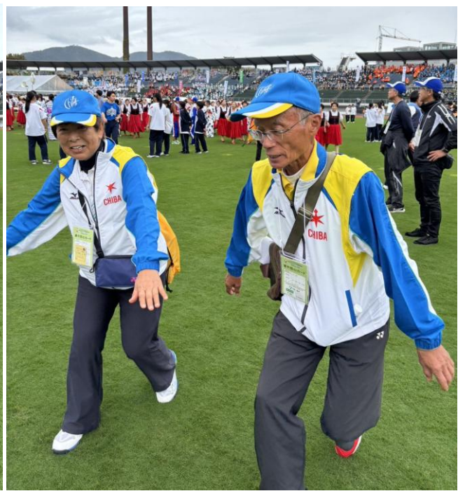
皆んなテニスより楽しそうに踊っていました