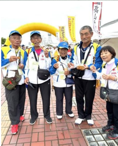
皆んな 先ずは腹ごしらえ