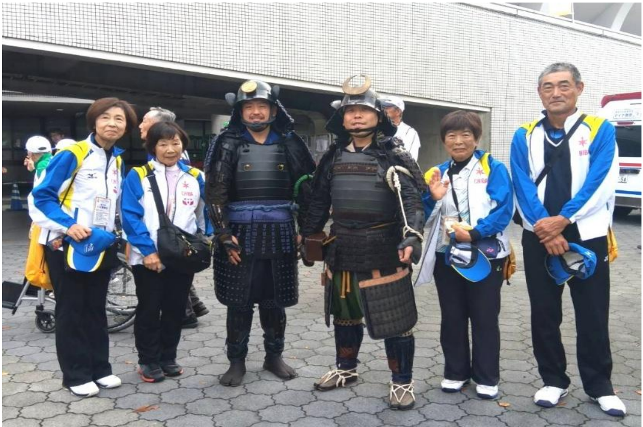
関ヶ原の戦い 戦国武将との記念撮影