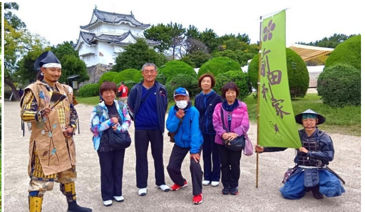
武将 前田利家らしき？と記念撮影