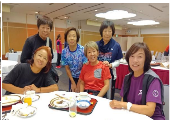
東京都ソフトテニスチームとの懇親交流