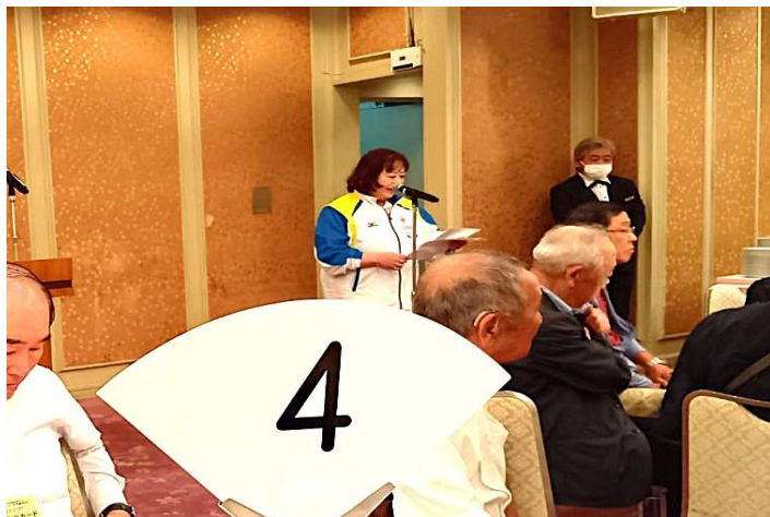
千葉県選手団長 激励のご挨拶