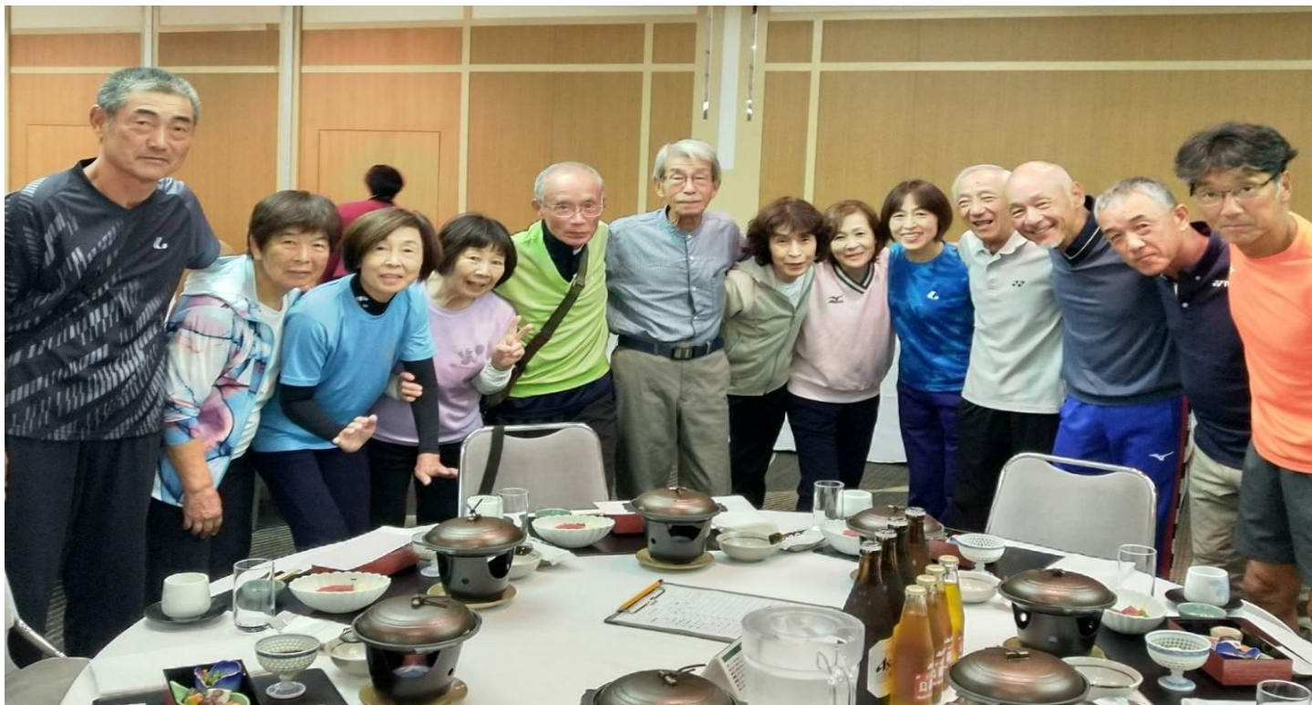
千葉県ソフトテニスチーム & 石川県ソフトテニスチーム と仲良く肩組んでハイポーズ！