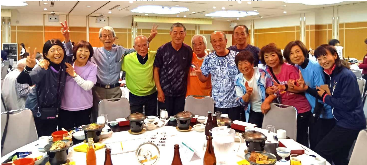
千葉県ソフトテニスチーム & 茨城県ソフトテニスチーム と隣県同士で仲良くなりましたあ～