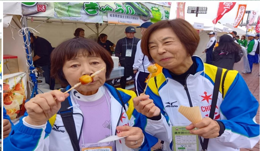
このみたらし団子うめえ～な