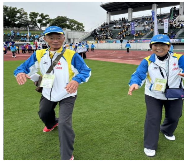
そうじゃないのこうだよ