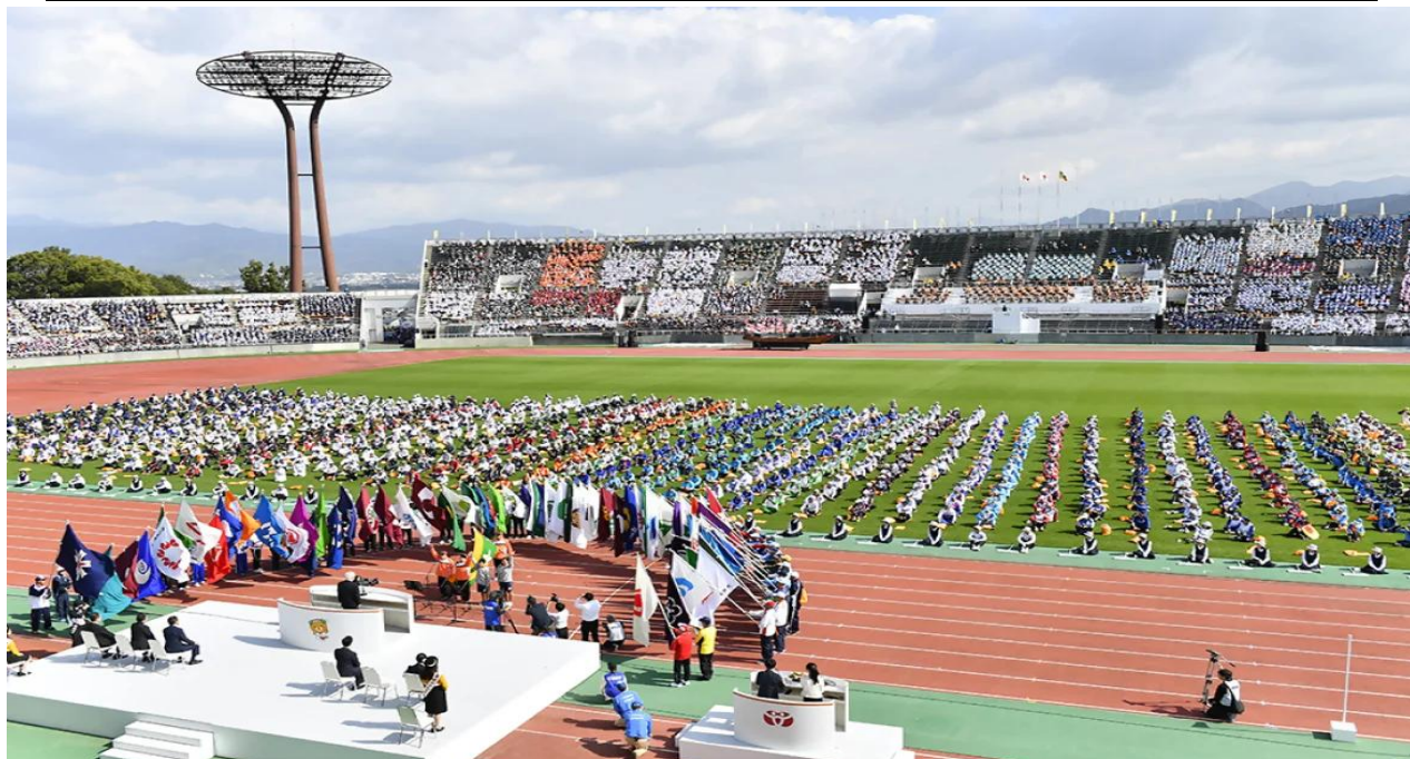
ねんりんピック2025岐阜大会 総合開会式（岐阜メモリアルセンター長良川競技場）