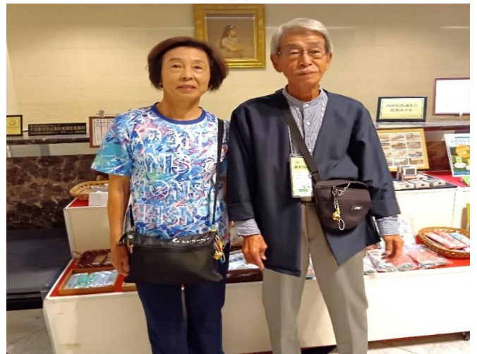
大垣フォーラムホテルのフロント