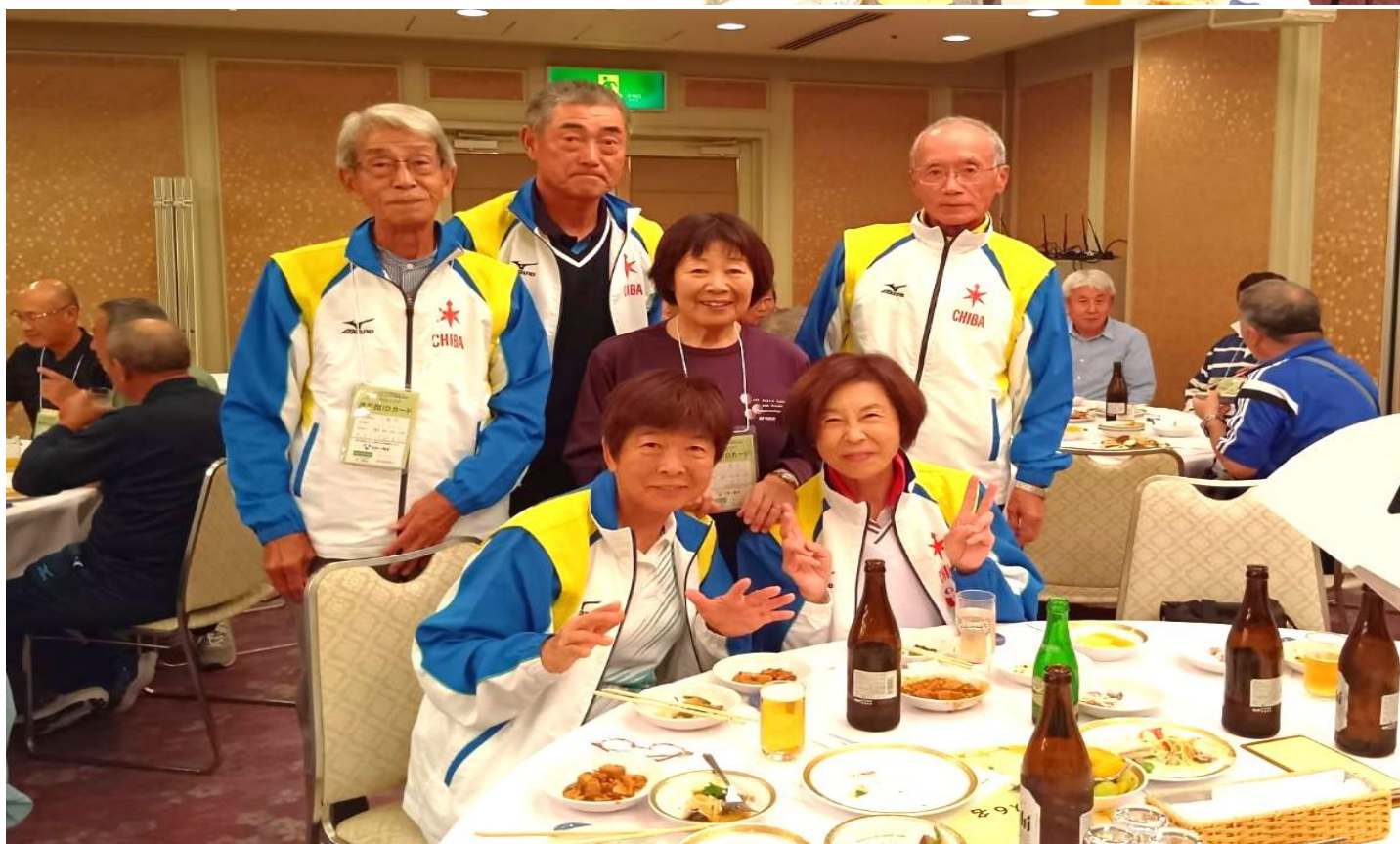
明日は総合開会式のみ、大いに飲んじゃえ！ でも飲み物は自腹負担！ ほどほどに……