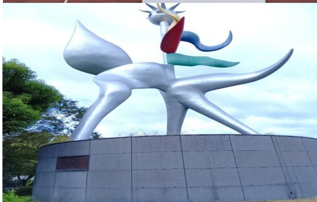
長良川競技場のシンボルモニュメント