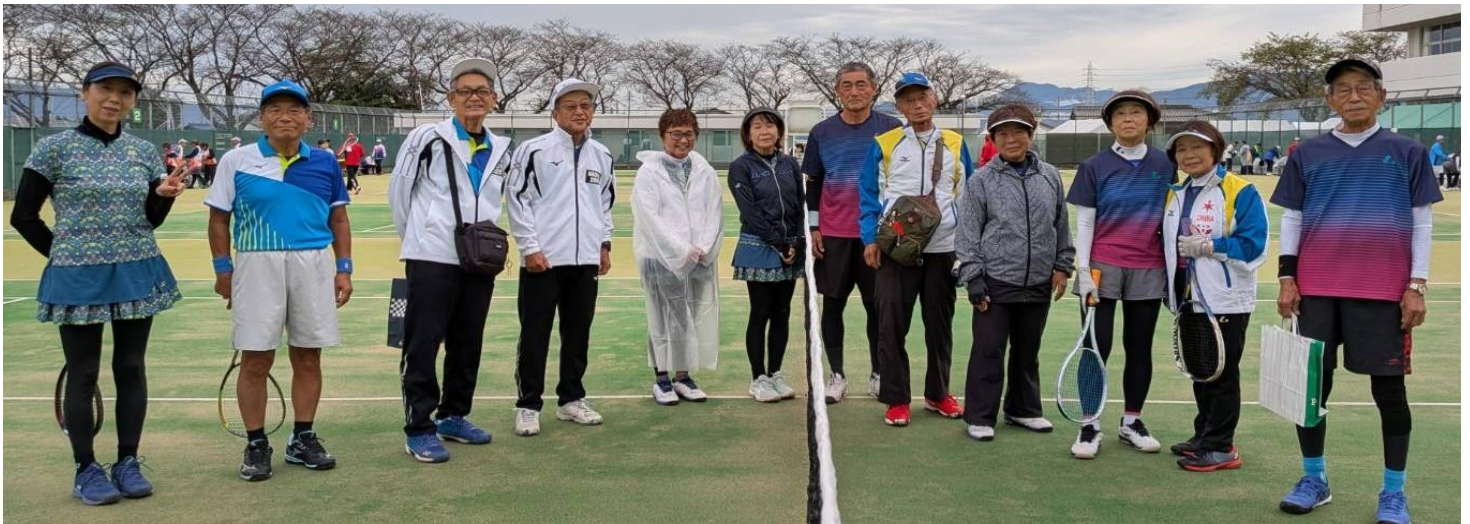
【予選リーグ戦（初日）】 第一試合 名古屋市 対 千葉県