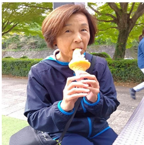
金 シャ チ 横 丁 の 金 粉 入 り ソ フ ト ク リ ー ム よ