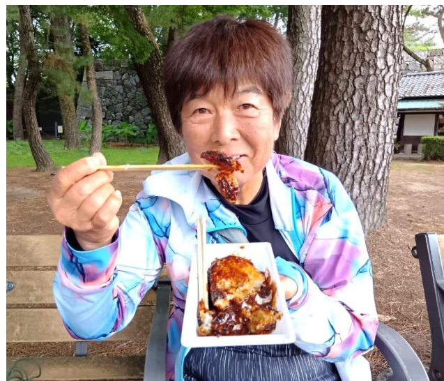
私 は 五 平 餅 よ