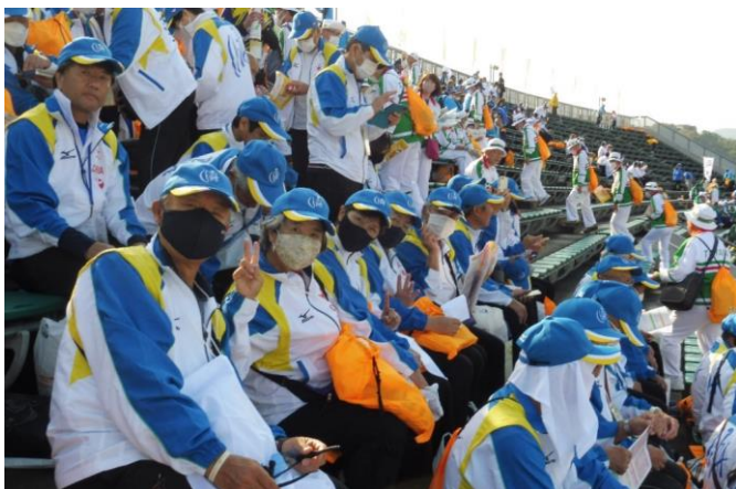
11月28日 総合開会式 愛媛県総合運動公園陸上競技場